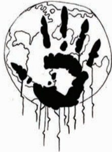
ILLUSTRAZIONE DI ENRICO MORINI

umentata. Tra i risvolti negativi del dominio incontrollato della natura, la mostra mette in luce l'estinzione accelerata di innumerevoli specie, la riduzione dei combustibili fossili e l'aumento delle emissioni di gas a effetto serra. Immagini maestose e toccanti mostrano miniere sconfiniate, barriere frangiflutti, bacini e impianti di estrazione, raffinerie, discariche, coltivazioni intensive e scenari desolanti di desertificazione e deforestazione.