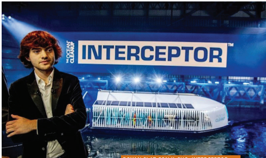
BOYAN SLAT CON IL SUO «INTERCEPTOR»

galleggiante lungo 1-2 km che si muove sfruttando il vento: è infatti tirato da una grande vela, simile, con le dovute proporzioni, a quella di un kite-surf. È rallentato da un'ancora a 600 m di profondità e un pannello rigido, applicato al di sotto di un tubo a pelo dell'acqua, raccoglie tutta la plastica in superficie. Di 001/B ce sono diversi in funzione. Si muovono liberamente nel vortice subtropicale del nord Pacifico e vengono poi recuperati da barche, che li portano alla terraferma dove vengono smaltiti i rifiuti.